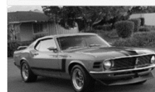
1970 Ford Mustang