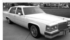
Cadillac Fleetwood Brougham